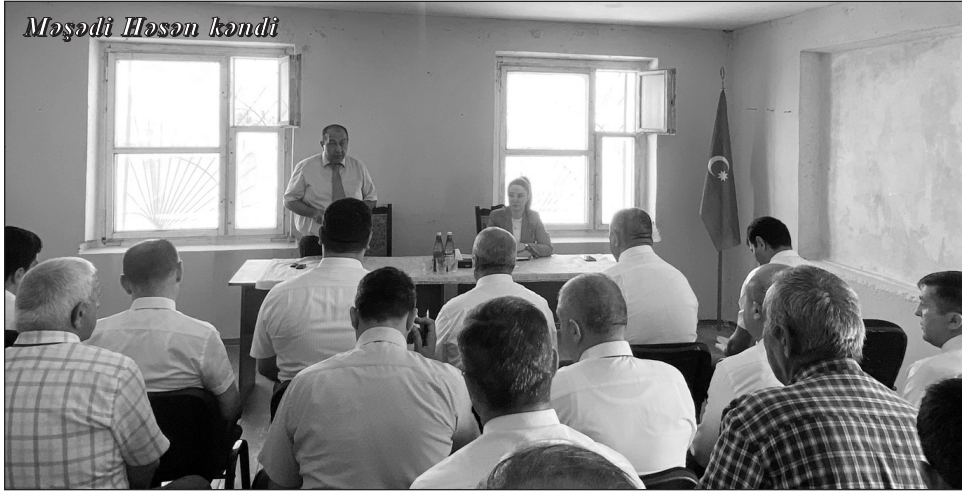
Məşədi Həsən kəndi